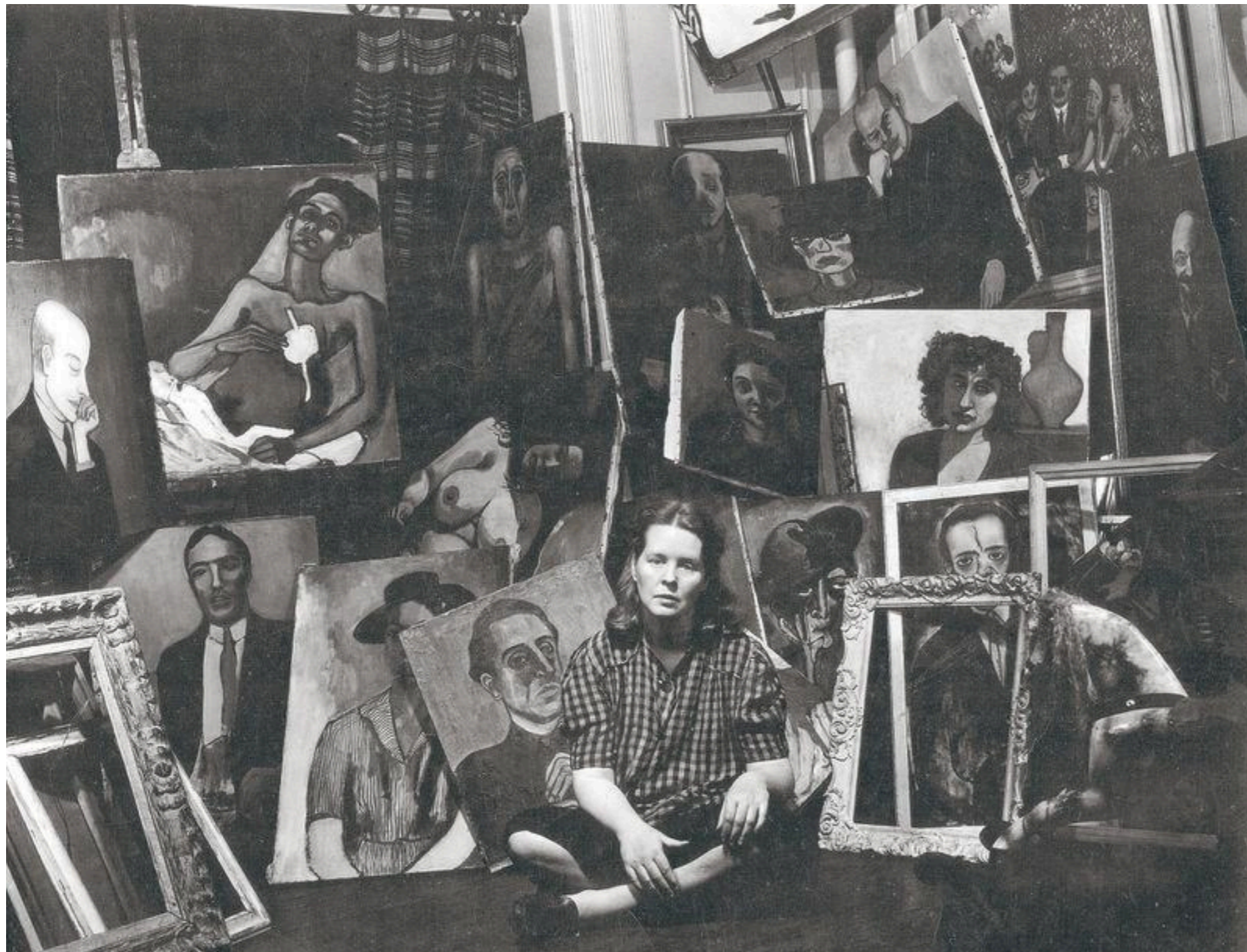
Links: Alice Neel, aufgenommen von Sam Brody, 1940 in ihrem Atelier Unten: „The Great Depression“ zeigt, wie todgeweiht und resigniert die Malerin 1933 die Menschen in ihrer Stadt New York erlebt