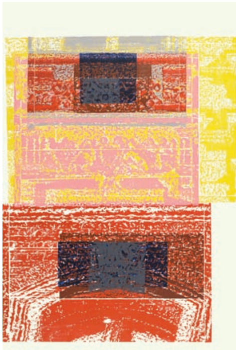
„Potsdamer Straße, Schlussstein“, 2015 Ed. 1/1, Farbholzschnitt, 220 x 145,5 cm