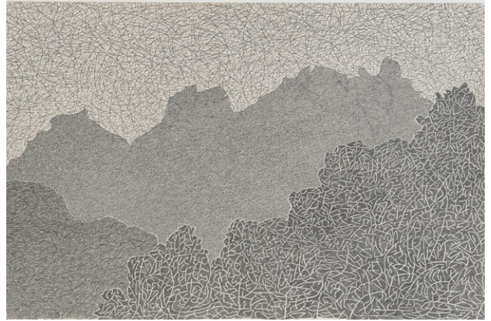
From Balcony, Bex, Curtain of Clouds, 2015-16, Graphit auf Papier (Detail)

Berlin – am 20. Januar 2017 eröffnet Aurel Scheibler die Einzelausstellung The Path des in Amsterdam lebenden, amerikanischen Künstlers Jonathan Bragdon. Die Ausstellung präsentiert, im Anschluss an die umfassende Werkschau im Kunstmuseum Appenzell 2016, eine Auswahl an Zeichnungen, Aquarellen und Gemälden, die seit dem Ende der 1960er Jahre bis heute entstanden sind.